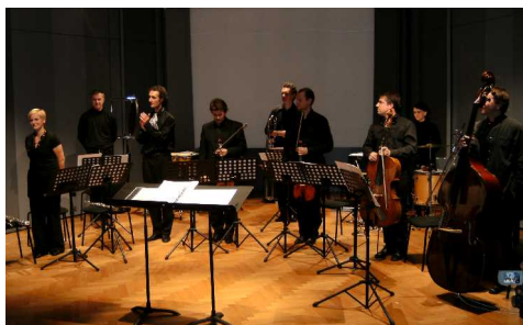
Arnold Schönberg Center, Wien 15.10.2009

Ein europäischer Querschnitt über die Farben der Unterwelt und die Schatten der Oberfläche.